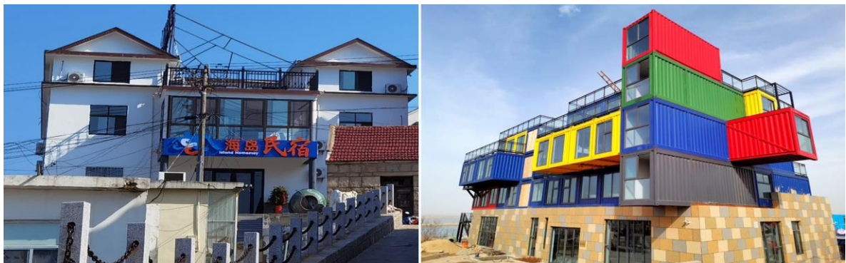
图9 改造后的民宿及改造中的集装箱小镇

渔港旅游注重趣味化亲海玩海。 为进一步提升街道旅游能级，带动居民共同富裕，将围绕“渔、港、海”文化元素，依托海港增加趣味化亲海玩海旅游体验功能，包括婚纱摄影、亲子渔乐、海上运动等多元化项目，在为拓宽居民就业增收渠道的同时，也美化了街区整体环境。