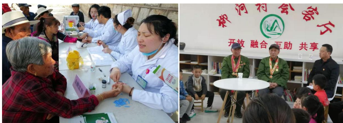
图7 居家养老中心定期举办各类活动现场

律维权、应急事件等服务。同时，对符合政府购买服务老年人提供入户巡诊的医养结合服务，涉及近百名老年人，实现街道全覆盖。定期举办节假日关爱老年人、健康体检等相关主题活动，使老年人能够真正“老有所养、老有所医、老有所教、老有所为、老有所学、老有所长。”