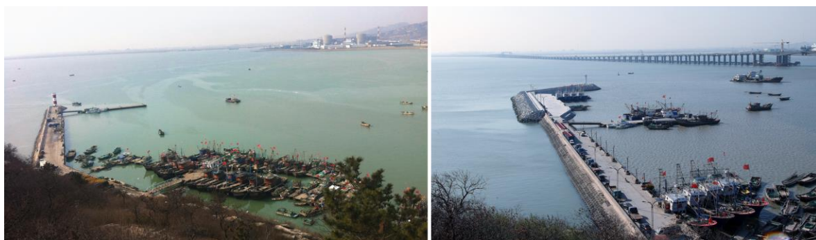
图3 渔港改造前（左）后（右）对比图

渔港功能完善服务渔民。 随着江苏沿海开发战略纳入国家层面，作为国家一级渔港，高公岛渔港的区域地位进一步提升。随着渔汛期间停靠渔船越来越多，高公岛渔港现有基础设施已无法满足渔船锚泊、卸货、补给需要，渔港整体功能提升已势在必行。通过聘请北京大洋碧海渔业规划设计院担纲渔港升级改造和整治维护实施方案，并获得省农业农村厅批复。围绕高公岛一级渔港建设，公益性基础设施采取扩建防波堤、增加码头泊位、疏浚港池、完善配套设施等手段，陆域经营性设施采取地方政府配套或招商引资等手段，完善了渔港整体功能，为渔民提供便利服务。