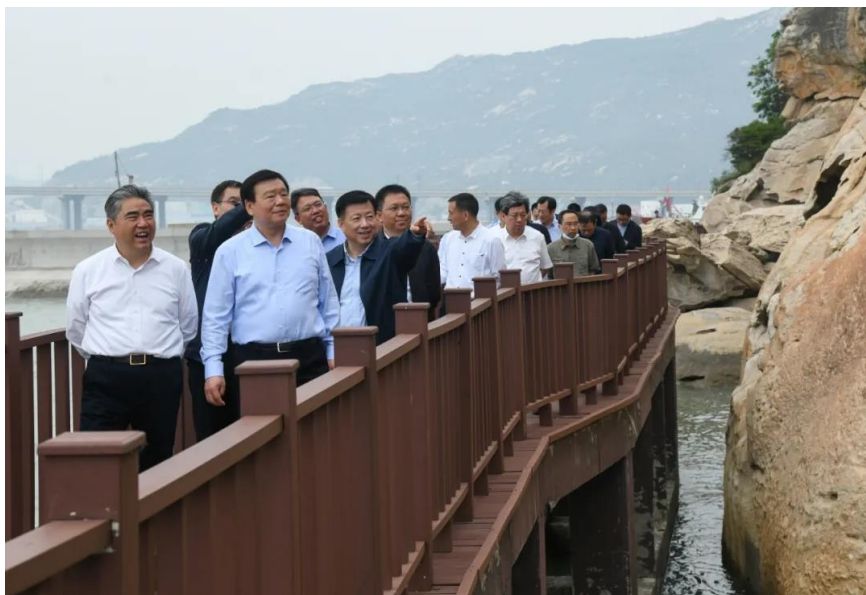
图1 娄勤俭书记考察连云区高公岛街道羊山岛

高公岛街道地处连云区最东端，三面环海，一面依山，依海而生，因海而兴，资源禀赋独特，海产品资源丰富，旅游资源优越，海滨大道、跨海大桥、国家一级渔港和田湾核电站在“山、海、岛、居”的背景中遥相呼应，形成一道美丽独特的风景线。今年5月，原省委书记娄勤俭在察看高公岛街道时指出，一定要加大科学保护的力度，做到在保护中发展、在发展中保护，建设好令人向往的沿海生态风光带。为积极落实国家、省、市关于滨海特色风貌塑造要求，为市民提供高品质亲海玩海空间，高公岛街道紧紧围绕“渔港、渔家、渔岛”三大主题，全力推进美丽宜居街区塑造。