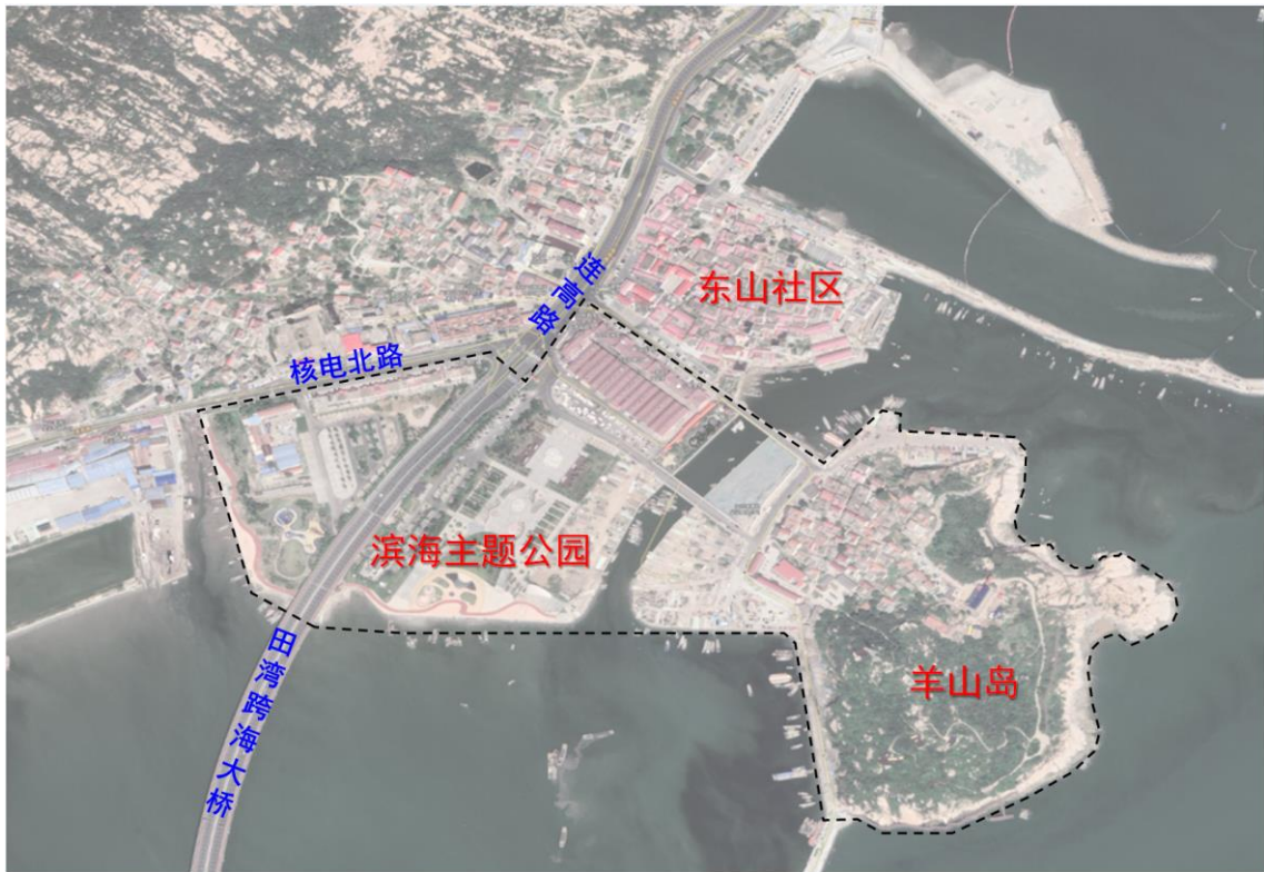
图 2 高公岛街道中心区示意图

高公岛街道通过粗放型外延式发展转向集约型内涵式城市更新，推进城市空间结构优化和品质提升，聚焦城市功能完善和内涵发展，完善渔港整体功能、实施海岛生态修复、打造公共活动空间、解决居民公共服务需求，不断提高生态承载力、产业融合度和城市宜居性，通过建设更加美好的滨海风情街区，提高居民幸福指数。