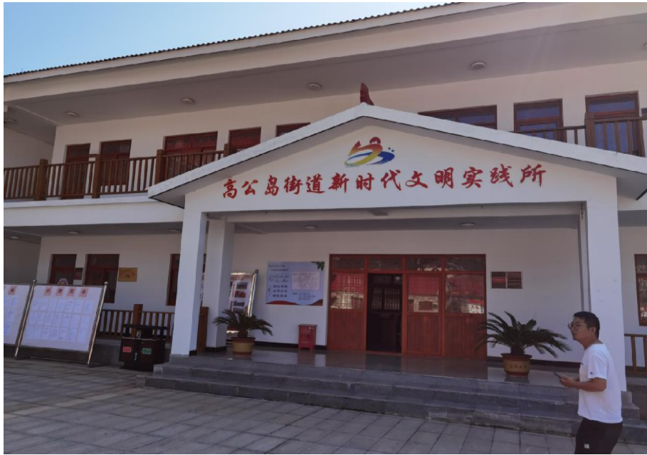
图 8 新建的新时代文明实践所