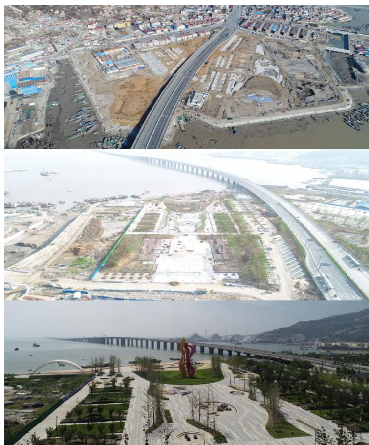
图5 滨海主题公园改造前（上）中（中）后（下）对比图