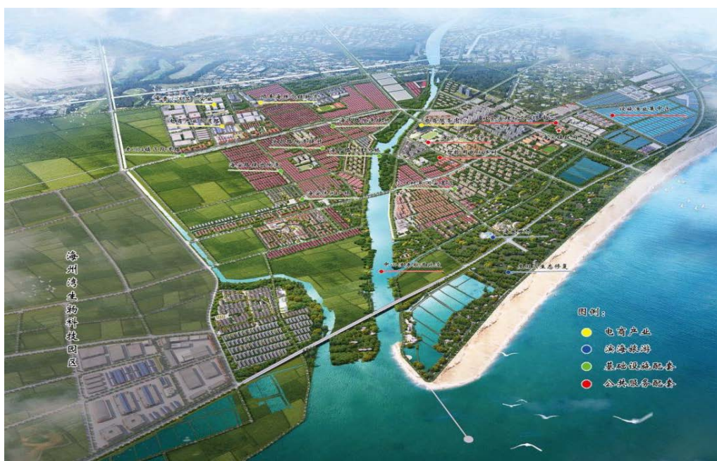
图 1 海头镇美丽宜居小城镇试点项目分布图

近年来，赣榆区紧紧围绕富民、便民、利民的发展理念，坚持以海洋产业发展和滨海生态建设为导向，充分发挥独特区位优势，强化要素保障，整合海洋渔业、滨海生态特色，放大直播电商优势，推动“业”“居”“旅”广泛融合，提升美丽小城镇的承载力、辐射力、带动力，全力打造集居民富裕、生活便利、环境优美、产业兴旺的美丽宜居滨海特色小城镇。