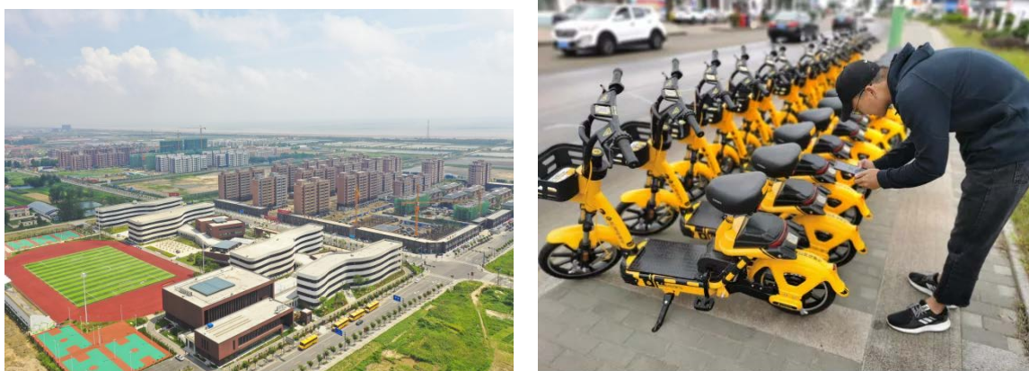
图7 海头镇中心小学（左）及共享单车（右）