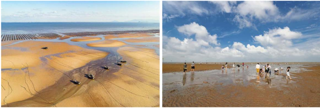
图3 海滩整治后效果

槐林、沙滩、海堤道路生态修复工程的实施，进一步提升了海洲湾旅游度假区的品质，加快了海滨浴场商业摊点的建设，可带动周边村民500余人到度假区经营海螺、珊瑚、贝壳等工艺品销售、从事海鲜特色餐饮业及其他服务业。据统计正常年份，年均接待游客60多万人次，从事工艺品销售、海鲜餐饮等各类服务的村民年均增收2000余元。