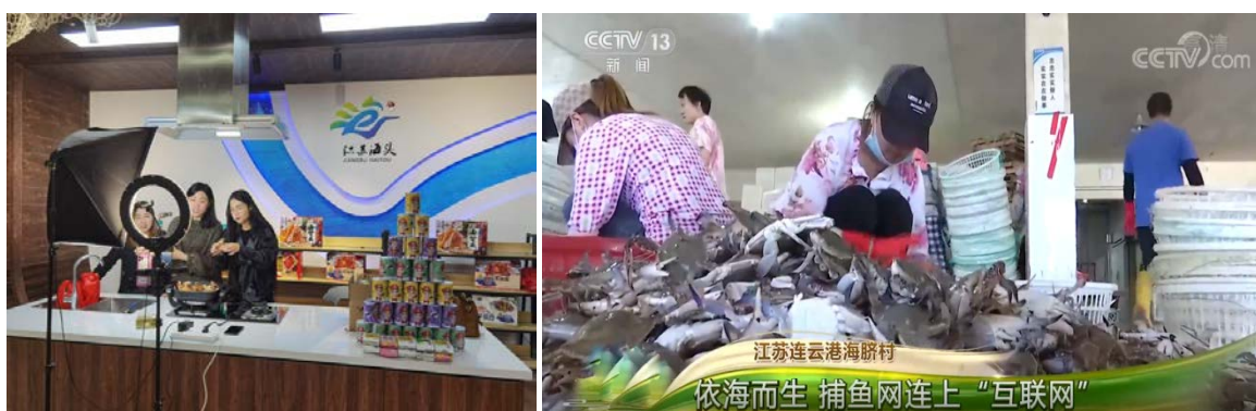
图5 海头镇电商直播现场（左）及央视专题报道（右）

完善电商服务配套功能。 为进一步促进电商富民发展，向养殖户和电商主播提供完善的基础设施服务，快速推进顺丰海鲜冷链物流服务中心、海头镇电商产业园、海后电商服务中心、峰叠实业生态电商中心等项目建设。其中，海头镇电商产业园围绕“楼上便民、楼下富民”目标，搭建“海鲜+直播”电商创业平台，强化电商孵化中心、创业培训中心等服务功能，今年以来开展网红交流、电商技能培训 100 余次，培育电商户 80 余家，渔民放下渔网走向互联网，200 余名创业青年跨入电商发展快车道。