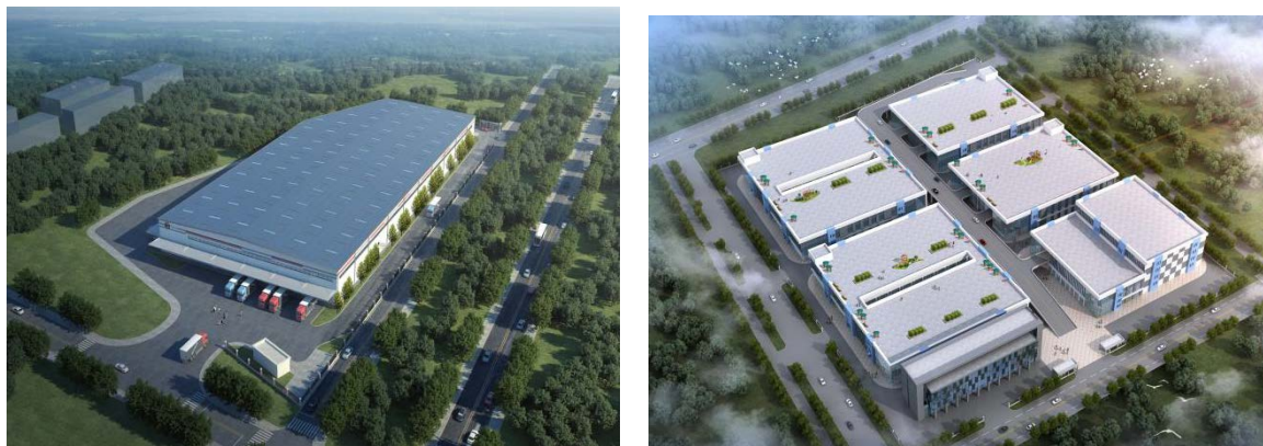
图4 顺丰冷链物流服务中心（左）和峰叠实业生态电商中心（右）

完善电商服务配套功能。 为进一步促进电商富民发展，向养殖户和电商主播提供完善的基础设施服务，快速推进顺丰海鲜冷链物流服务中心、海头镇电商产业园、海后电商服务中心、峰叠实业生态电商中心等项目建设。其中，海头镇电商产业园围绕“楼上便民、楼下富民”目标，搭建“海鲜+直播”电商创业平台，强化电商孵化中心、创业培训中心等服务功能，今年以来开展网红交流、电商技能培训 100 余次，培育电商户 80 余家，渔民放下渔网走向互联网，200 余名创业青年跨入电商发展快车道。