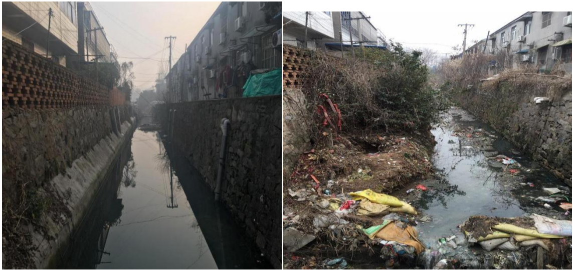
水体整治前后对比