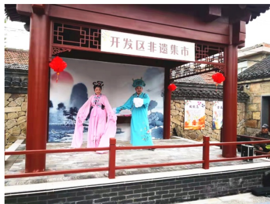
“张学瀚故居”举行民俗文化演出

如何赋予这座旧建筑新的使命，让它“活”起来？连云港开发区始终秉持匠人之心，按照修旧如旧的原则对历史建筑进行修缮、保护，精心打造街区文化传播驿站，组织古建家完成对将新县老街