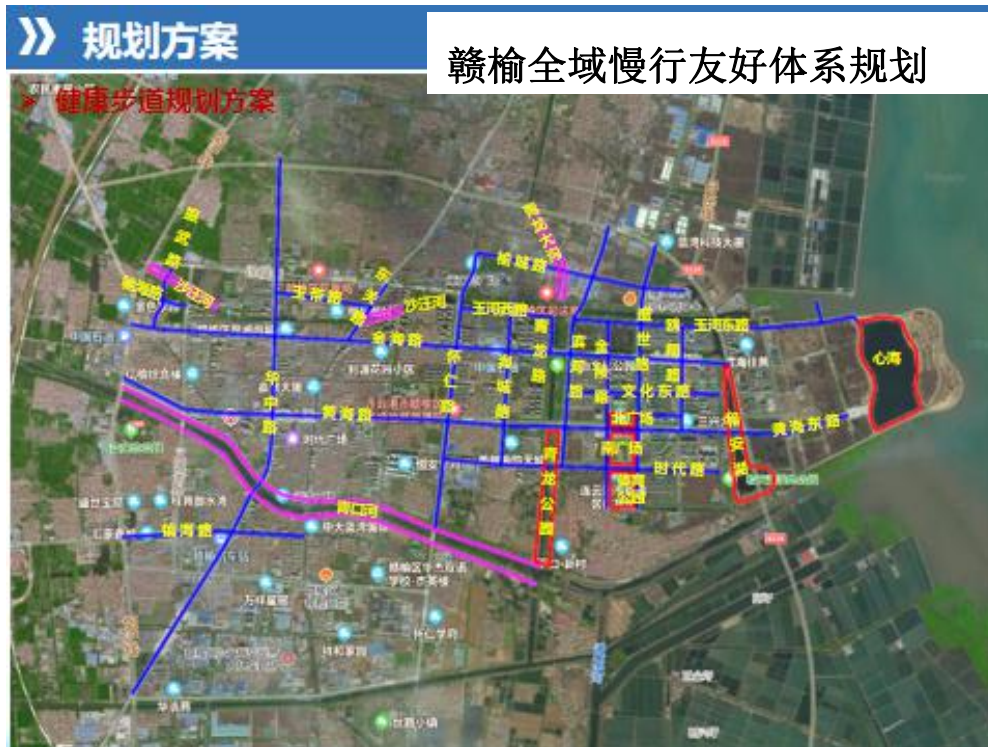
健康步道规划方案图