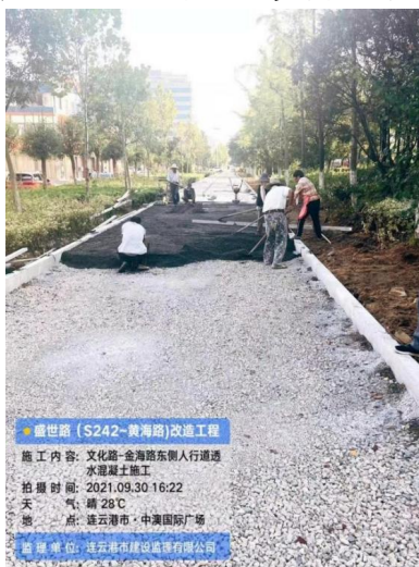
盛世路透水混凝土施工中