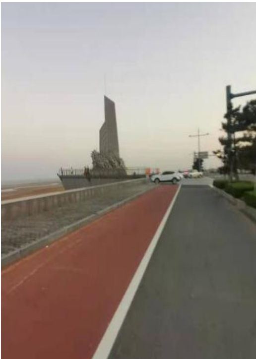
海滨自行车道实景图

项目实施中采用系统思维，围绕新老城区、公园绿地、城市水系、文体设施、公交枢纽、商业街区、居民小区、海滨旅游等功能布局，尤其通过“公园绿地+”体系建设，以健康步道串联商业综合体、医院、