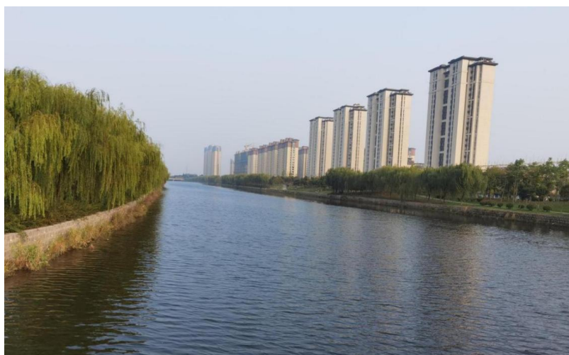
雨污分流后沙汪河实景图

一是启动金海路、盛世路、琴岛路、滨河路、文化东路、体育公园、市民广场等改造更新项目，按照断面优化、慢行优先的原则建设健康步道。二是结合雨污分流配套建设，在新城片区、金福片区污水达标区建设中，通过局部改造配建健康步道。三是植入海绵城市建设理念，在设计施工中，遵循海绵城市理念，采用新材料、新工艺，健康步道结构层使用透水混凝土，面层使用透水沥青；游园改造利用地形，增加雨水花园、透水材料铺装等，