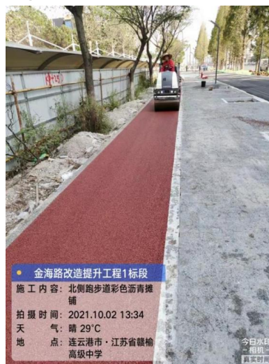
金海路透水沥青施工中