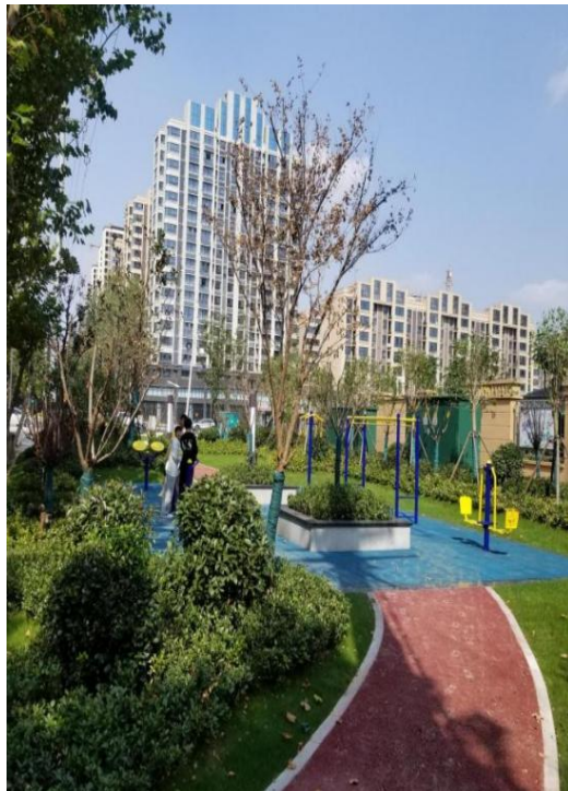
怀仁路街头游园实景图

中学、湿地公园等，做到以点连线，以线串面，以面成环；同时配套标识、标牌、驿站、公厕、座椅等便民设施，使市民在绿色