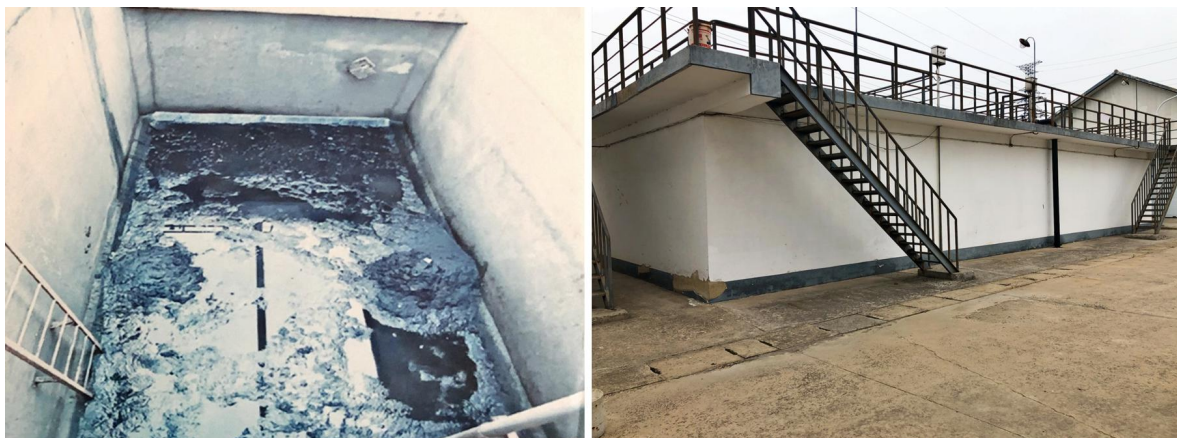
图 9 污水处理站改造前（左）后（右）对比图

（一）注重河道生态功能修复。完成 3.2 公里南河整治清淤、河底硬化、生态护坡及等配套工程，消除了整治前的黑臭水体，河水变得清澈干净。同时，实施了 400 米万寿涧综合整治工程，打造生态景观蓝带。