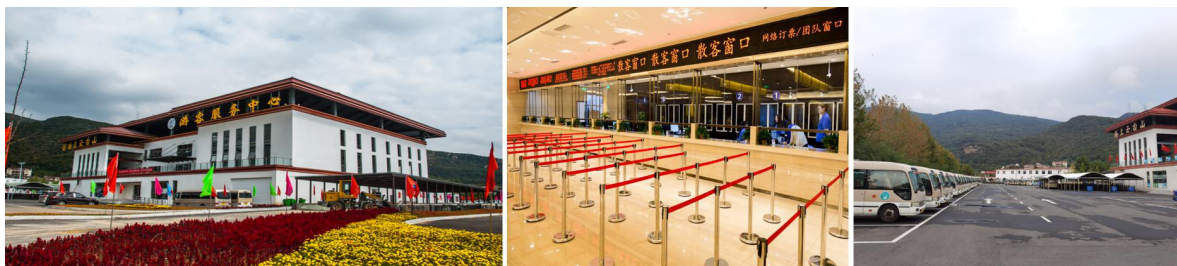
图7 建设完成的游客服务中心（左、中）及停车场大巴停车区（右）

（二）提升市政设施功能品质。完成主镇区 550 户燃气管道铺设通气并常态化使用，实现街道管道燃气全覆盖。铺设供水管道 73 公里，泵站 11 个，高山区域及主镇区实现自来水通水。完成东崖屋、桃源路、苹果园一条街电路入地改造。建成日处理量 1000 吨的污水处理站及 55 公里污水管网，污水接管率达 95% 以上。新建便民路灯 700 余盏，便民道路约 1 万米，彻底解决山民出行难问题。