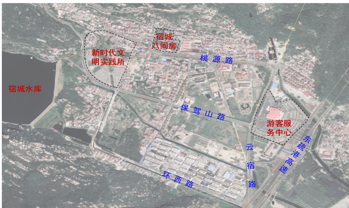
图 1 项目分布图

宿城街道三面环山，一面临海，拥有海上云台山、枫树湾、船山、保驾山等 4 个主景区 26 个分景点，是云台山国家级风景名胜区和国家森林公园所在地。街道荣获“中国十佳村镇慢游地”、“美丽中国最佳康养旅游街道”、“省级第二批旅游风情小镇创建单位”、“省特色景观旅游名乡”等诸多荣誉称号。宿城街道以建设美丽旅游示范区为目标，紧紧围绕人民群众的切身感受，满足人民群众日益增长的美好生活向往，按照 文旅宿城、便利宿城、绿满宿城、富民宿城、魅力宿城 的建设目标，全力推进宜居宜业宜游的全域旅游示范区塑造。