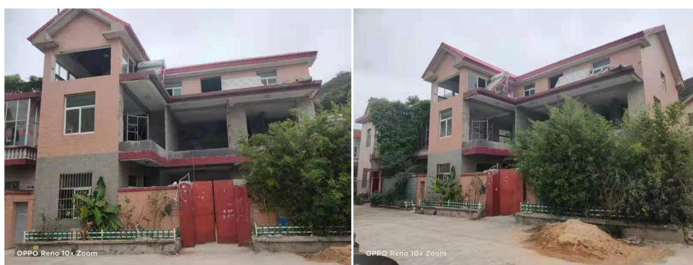
图3 居民利用自有住房建设民宿（施工现场）