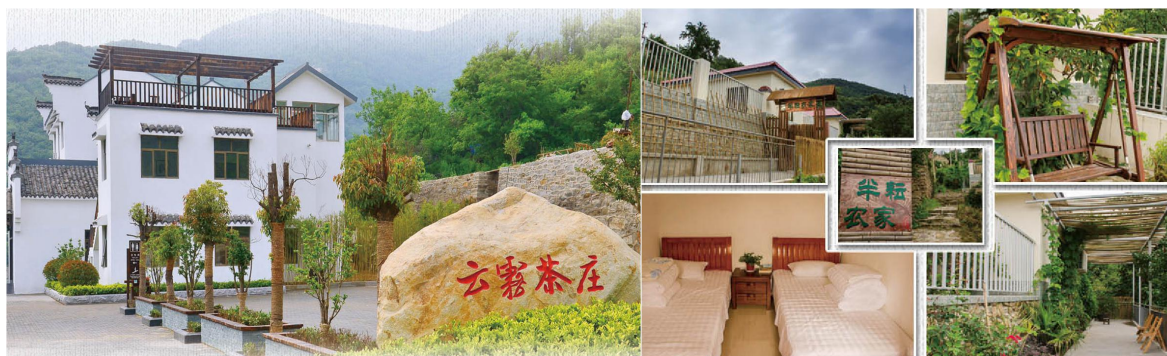
图4 居民自发建设的民宿现状

（二）机制创新促进民宿发展。成立连云区宿城街道农家乐领导小组和宿城农家乡村酒店行业协会，出台了宿城街道农家乐发展扶持政策，制定了《宿城街道特色农家乐项目标准》、《宿城街道特色农家乐项目标准》、《宿城街道农家乐管理办法（暂行）》、