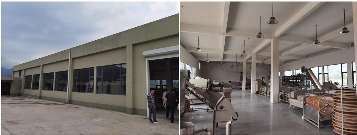
图 11 宿城茶叶加工厂现状

江苏·最美体育山地自行车联赛等体育赛事。其中，2018年采茶节·楸树花节被中央电视台7频道播出报道；2019、2020年采茶节·楸树花节被中央1套新闻报道及江苏新时空播出报道。通过多元化民俗节庆活动，街道知名度和美誉度显著提升，宜居宜业宜游特色文化品牌不断亮化。