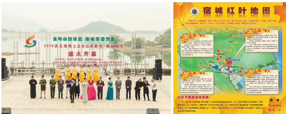
图 12 楸树花节·采茶节（左）及宿城红叶地图（右）

江苏·最美体育山地自行车联赛等体育赛事。其中，2018年采茶节·楸树花节被中央电视台7频道播出报道；2019、2020年采茶节·楸树花节被中央1套新闻报道及江苏新时空播出报道。通过多元化民俗节庆活动，街道知名度和美誉度显著提升，宜居宜业宜游特色文化品牌不断亮化。