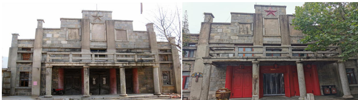
图2 “八间房”门楼改造前（左）后（右）对比图