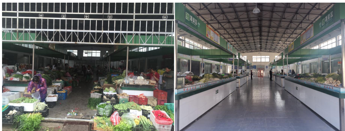
图 10 农贸市场改造前（左）后（右）对比图

（三）注重小微空间环境改善。对与居民生活紧密相关的农贸市场进行改造，改变了过去脏乱差的购物环境，提升了整体卫生环境水平，形成一道整洁靓丽的城镇风景线。