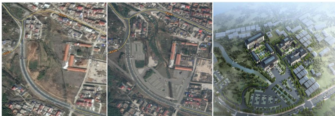
图 6 新时代文明实践所及周边改造前（左）、现状（中）影像图及改造效果图（右）

（二）打造主客共享服务平台。小镇客厅（新时代文明实践所）位于保驾山路北、桃源西路南，包括综合实践中心 1 个，党建阵地、百姓会客厅、便民服务综合体等功能厅室 8 个，多功能报告厅 1 个，展示厅 1 个，以及产业孵化基地 1 个。其中产业孵化基地可提升产业孵化成功率，提供 50 个就业岗位；百姓会客厅增加室内文体活动空间，丰富居民文娱活动、促进群众文明进步。